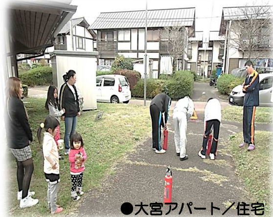
●大宮アパート/住宅

各団地において、入居者を対象に消防訓練を実施しました。訓練内容は、大きく分けて三つあります。消火訓練(消火器を使用した初期消火訓練)、避難訓練(避難、誘導及び避難器具訓練)、通報訓練(発災の確認後、周りの入居者へ周知し消防機関へ通報する訓練)の三つです。県営住宅では、毎年全焼の火災が3〜4件、不審火等による小火が5〜6件発生しています。